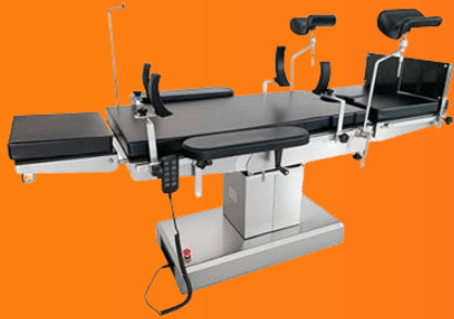
Mesas de cirugía