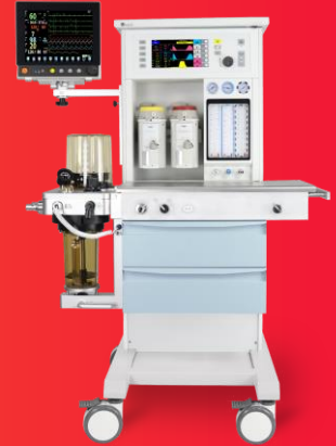
Máquina de anestesia