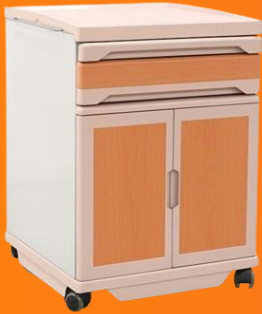
Mesas de luz