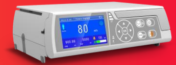
Bombas de infusión