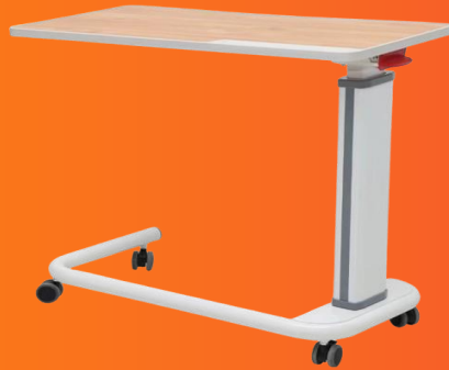
Mesas de comer