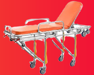
Camilla para ambulancia